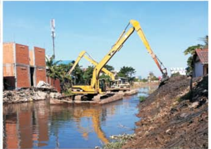
សកម្មភាពត្រៀមចក្រកំពុងកាយដីភក់ ចេញពីប្រឡាយ