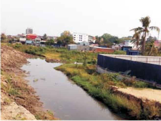
សកម្មភាពត្រៀមចក្រកំពុងកាយស្ពាន កំណែខ្សាច់ពីប្រឡាយអូរចាក់ទូក