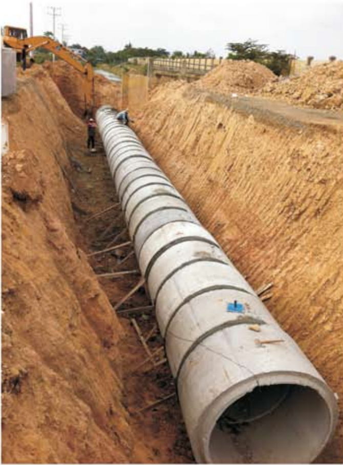
ការស្ថាបនាសំណង់ស្រោចស្រព ដំណាំស្រូវតំបន់ក្រាំងពង្រ ខណ្ឌដង្កោ រាជធានីភ្នំពេញ