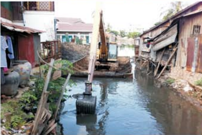
សកម្មភាពត្រៀមចក្រកំពុងកាយកំណែសំណល់ និងខ្សាច់ចេញពីប្រឡាយ