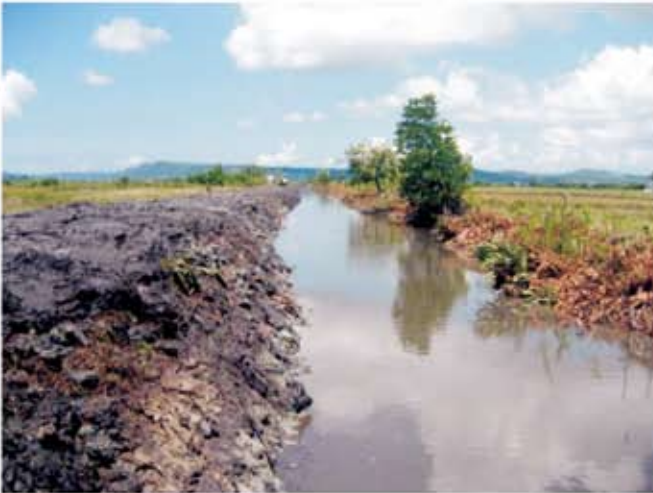
ទិដ្ឋភាពប្រឡាយក្រោយពេលស្តាររួច