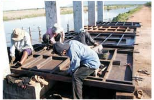
ទិដ្ឋភាពរួមនៃការជួសជុលសន្ទះទ្វារទឹកក្នុងប៉ូលខ្សែទាំង ៦