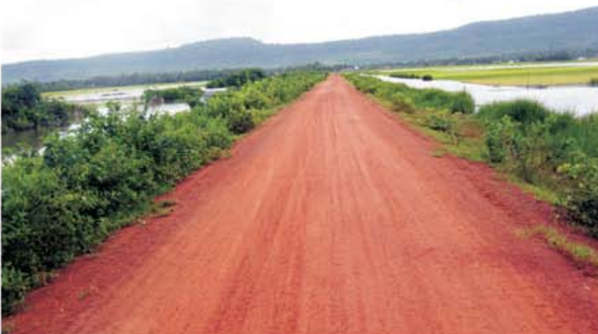
ទិដ្ឋភាពទំនប់ក្រោយពេល ជួសជុលរួច