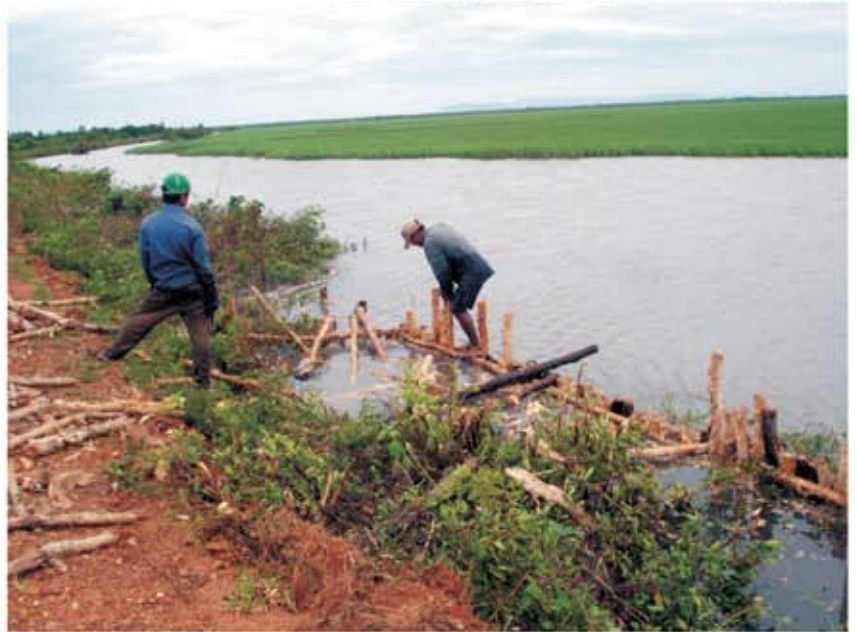
សកម្មភាពបោះបង្គោលស្មាច់ដាក់រៀងលើទប់ជើងទេរទំនប់