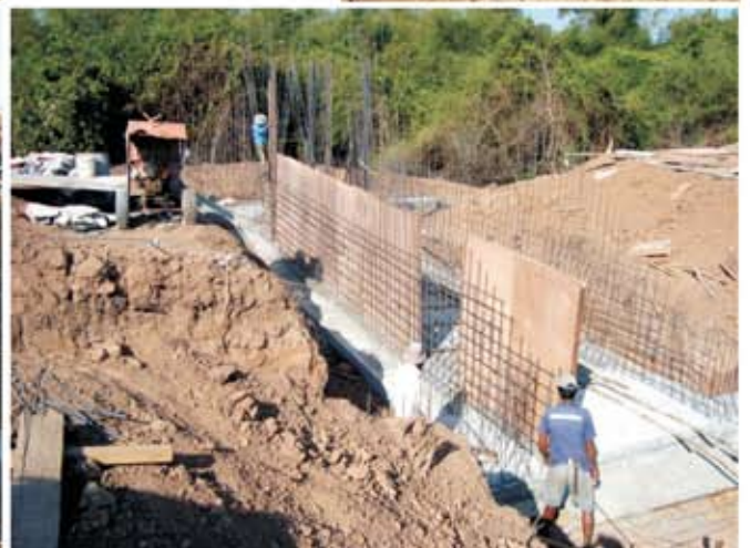
សកម្មភាពដំឡើងការពុម្ពដើម្បីត្រៀមចាក់បេតុងសំណង់ស្នាក់ទឹក