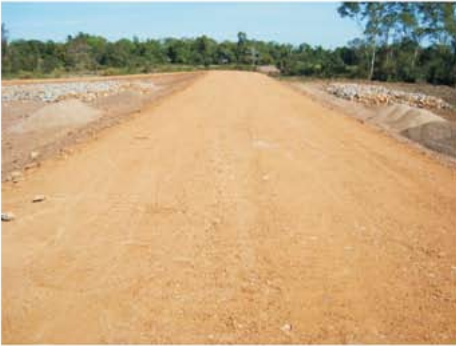
ទិដ្ឋភាពទូទៅនៃប្រព័ន្ធធារាសាស្ត្រកំពង់រាំង

គម្រោងស្តារឡើងវិញនូវប្រព័ន្ធធារាសាស្ត្រកំពង់រាំង មាន ទីតាំងស្ថិតនៅក្នុងឃុំហាន់ជ័យ ស្រុកឆ្លូង ខេត្តក្រចេះ ។ គម្រោងនេះស្ថិតក្រោមថវិកាជំនួយឧបត្ថម្ភពីធនាគារ អភិវឌ្ឍន៍អាស៊ី (ADB) ។ ប្រព័ន្ធធារាសាស្ត្រនេះ មាន សមត្ថភាពផ្តល់ទឹកសម្រាប់ស្រោចស្រពលើផ្ទៃដីស្រូវ ប្រដេញទឹកបានចំនួន ១.៥០០ហិ.ត ។