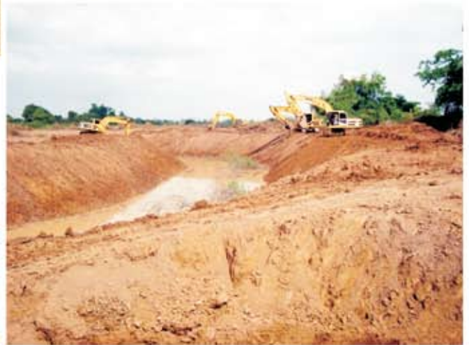
សកម្មភាពត្រៀមចក្រកំពុងកាយដីស្តារប្រឡាយ

គម្រោងស្តារឡើងវិញនូវប្រព័ន្ធធារាសាស្ត្រកំពង់រាំង មាន ទីតាំងស្ថិតនៅក្នុងឃុំហាន់ជ័យ ស្រុកឆ្លូង ខេត្តក្រចេះ ។ គម្រោងនេះស្ថិតក្រោមថវិកាជំនួយឧបត្ថម្ភពីធនាគារ អភិវឌ្ឍន៍អាស៊ី (ADB) ។ ប្រព័ន្ធធារាសាស្ត្រនេះ មាន សមត្ថភាពផ្តល់ទឹកសម្រាប់ស្រោចស្រពលើផ្ទៃដីស្រូវ ប្រដេញទឹកបានចំនួន ១.៥០០ហិ.ត ។