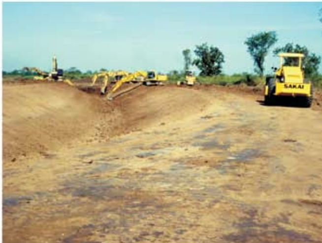
សកម្មភាពត្រៀមចក្រកំពុង ល្អសសំអាតដីលើ ខ្នងប្រឡាយ