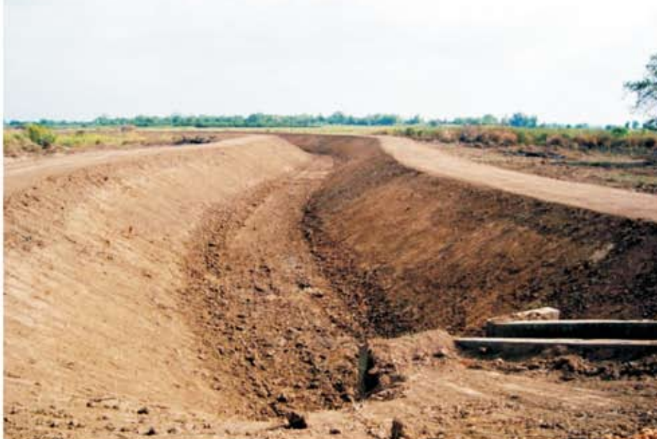
ទិដ្ឋភាពប្រឡាយ ក្រោយពេលស្តាររួច បាន ៨០ភាគរយ