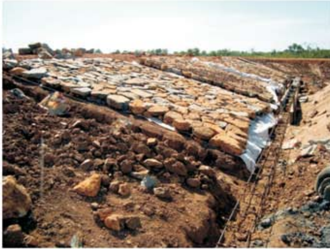
ទិដ្ឋភាពជើងទេរទំនប់ ក្នុងពេលរៀបចំដោយ ការពារដោយស្បែកប្រោះទឹក