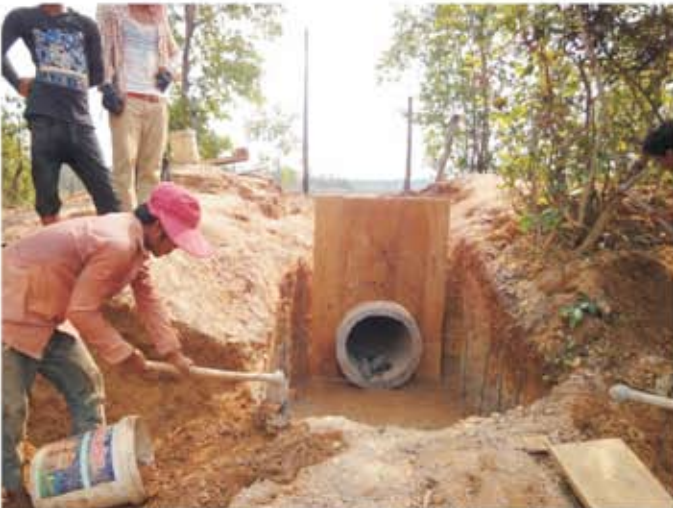
ទិដ្ឋភាពសំណង់លូក្នុងពេលកំពុងសាងសង់