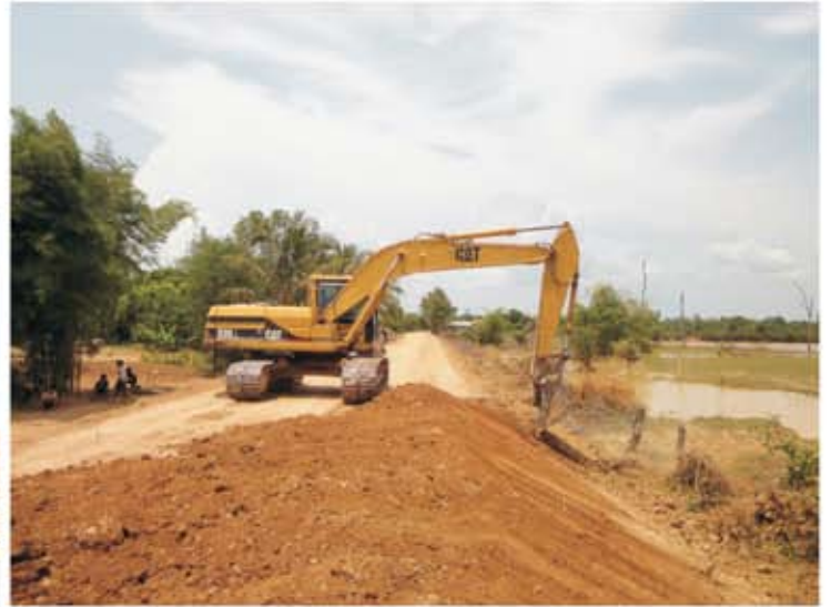
ទិដ្ឋភាពសំណង់បង្ហូរ ក្នុងពេលកំពុងសាងសង់