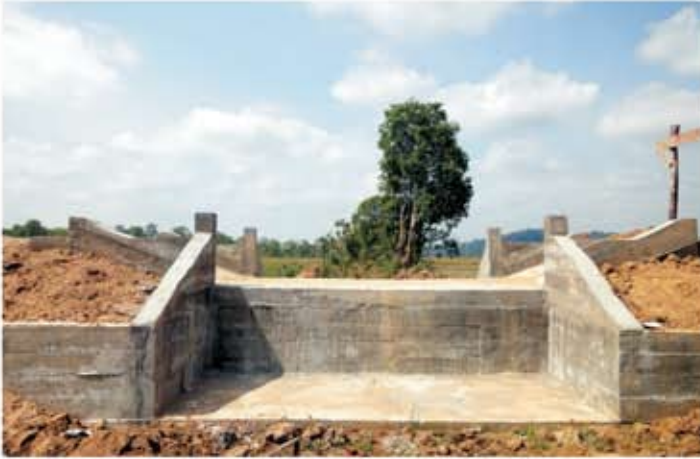
ទិដ្ឋភាពសំណង់បង្ហូរក្នុងពេលសាងសង់សម្រេចបាន ៩០ភាគរយ