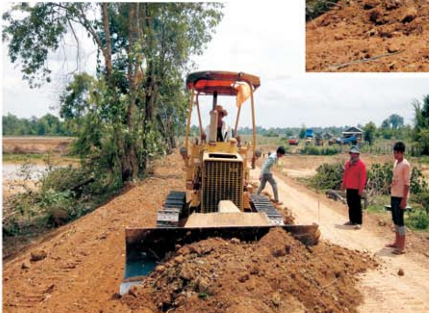
សកម្មភាពគ្រឿងចក្រកំពុង ល្អូសឆាយដីលើខ្នងទំនប់