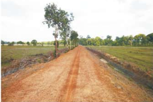
ទិដ្ឋភាពទំនប់វាលសាធាមក្រោយពេលជួសជុលរួច

ប្រព័ន្ធធារាសាស្ត្រវាលសាធាម មានទីតាំងនៅភូមិថ្មី ឃុំសេដា ស្រុកសំរោង ខេត្តតេជោ ។ ទំហំការងារដែលត្រូវធ្វើរួមមាន សាងសង់លូចំនួន ០១កន្លែង និងសំណង់បង្ហូរចំនួន ០១កន្លែង ។