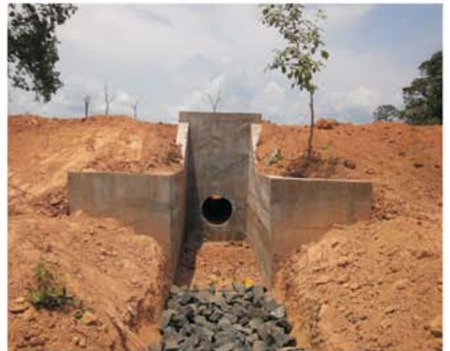
ទិដ្ឋភាពសំណង់លូ ក្នុងពេលកំពុងសាងសង់