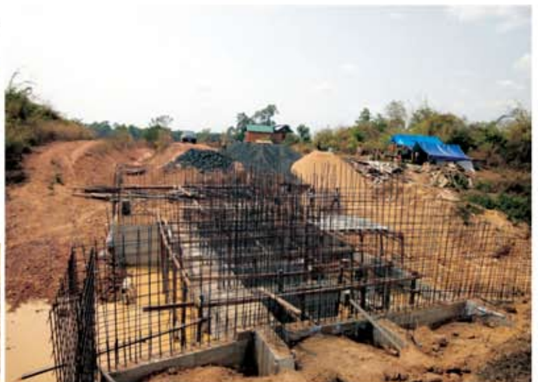
ទិដ្ឋភាពសំណង់បង្ហូរកាត់អូរក្នុងពេលកំពុងសាងសង់

ប្រព័ន្ធធារាសាស្ត្រអូរលើង មានទីតាំងនៅភូមិកាចូន ឃុំកាចូន ស្រុករឹងសែ ខេត្តរតនគិរី ។ ទំហំការងារដែលត្រូវធ្វើរួមមាន ស្ដារប្រឡាយមេចំនួន ០១ខ្សែ ប្រឡាយរងចំនួន ០៣ខ្សែ និងសាងសង់សំណង់បង្ហូរចំនួន ០១កន្លែង ។