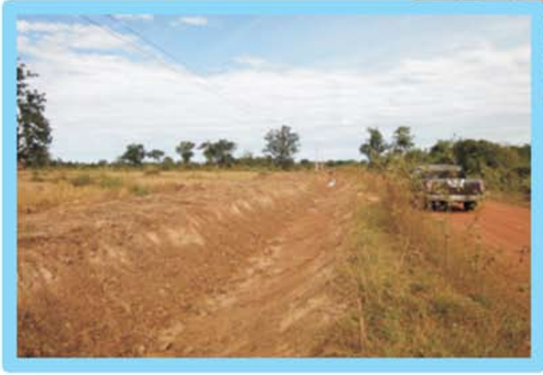
ទិដ្ឋភាពប្រឡាយមេ ក្រោយពេលស្តាររួច

ប្រព័ន្ធធារាសាស្ត្រចុងកាតូន មានទីតាំងនៅភូមិបានហ្វាំង ឃុំប៉ុង ស្រុកវ៉ែសឺន ខេត្តរតនគិរី ។ ទំហំការងារដែល ត្រូវធ្វើរួមមាន ជួសជុលទំនប់អាងទឹកចំនួន ០១កន្លែង សាងសង់សំណង់លូចំនួន ០១កន្លែង និងសាងសង់សំណង់ បង្ហៀរចំនួន ០១កន្លែង ។