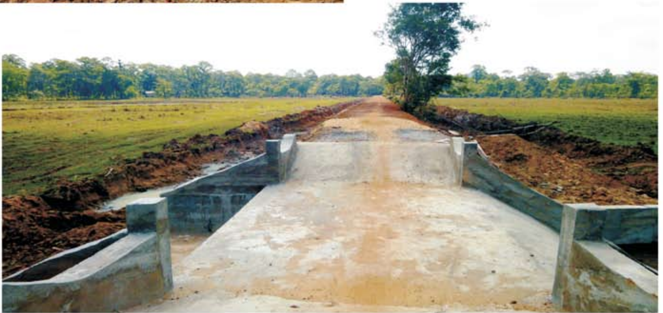
ទិដ្ឋភាពសំណង់បង្ហូរក្រោយពេលសាងសង់រួច

ប្រព័ន្ធធារាសាស្ត្រអូរលើង មានទីតាំងនៅភូមិកាចូន ឃុំកាចូន ស្រុករឹងសែ ខេត្តរតនគិរី ។ ទំហំការងារដែលត្រូវធ្វើរួមមាន ស្ដារប្រឡាយមេចំនួន ០១ខ្សែ ប្រឡាយរងចំនួន ០៣ខ្សែ និងសាងសង់សំណង់បង្ហូរចំនួន ០១កន្លែង ។