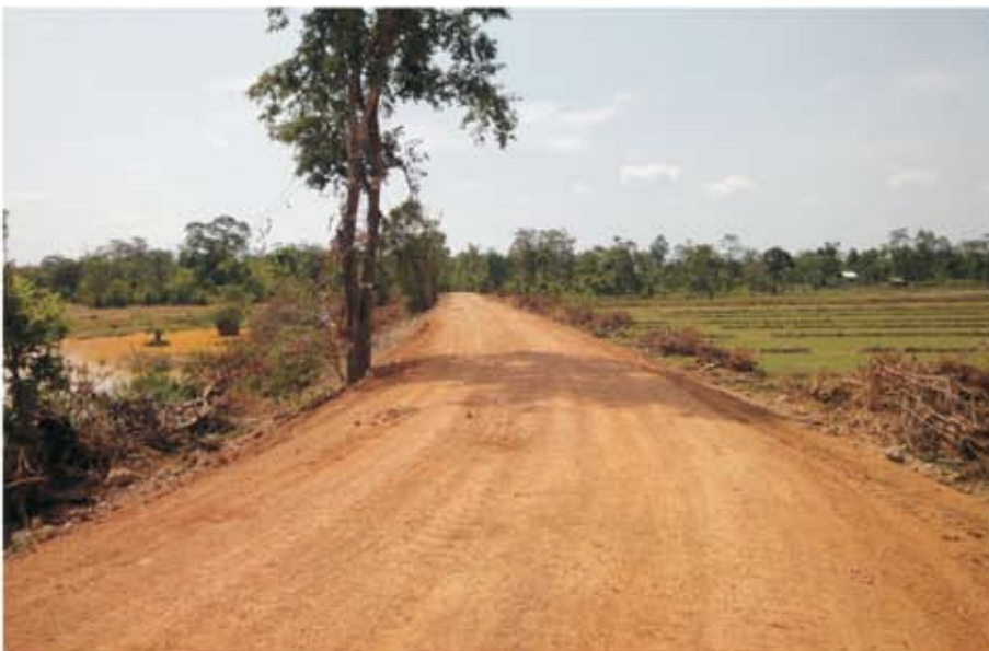
ទិដ្ឋភាពទំនប់អាងទឹកថងកាចូន ក្រោយពេលជួសជុលរួច